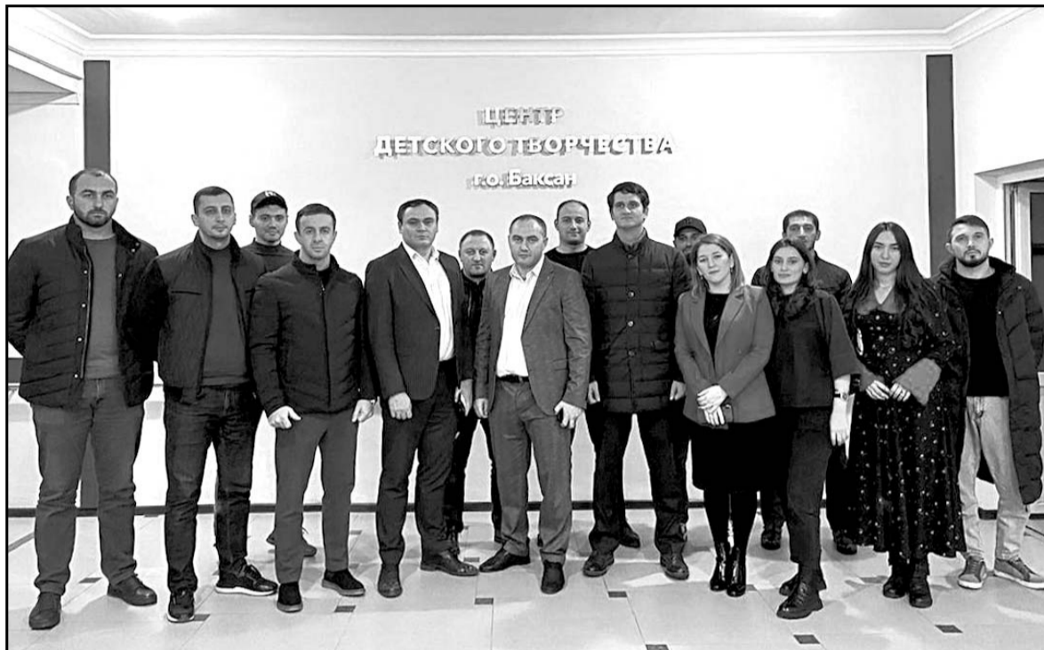
• Выездной муниципальный форум

В соответствии с постановлением Правительства РФ Госкомитетом КБР по тарифам и жилищному надзору также завершена процедура принятия тарифов на коммунальные услуги.